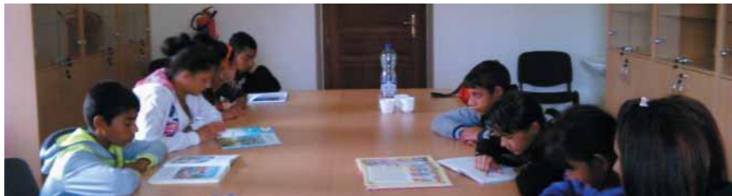
Skupinové čítanie v priestoroch obecnej knižnice v Jarovniciach