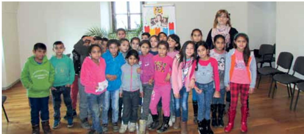
Osmijankovi čitatelia z 3.A