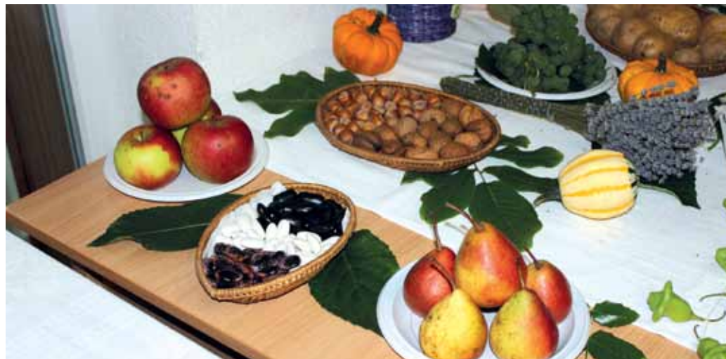
Plody zeme