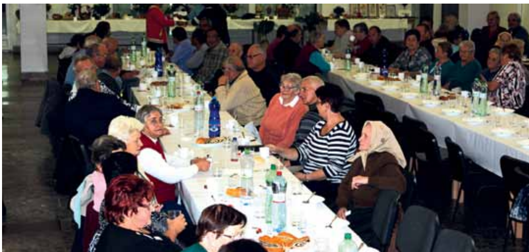
Prítomní hostia