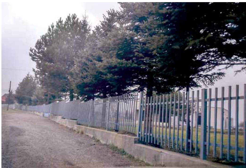
Novonatreté oplotenie