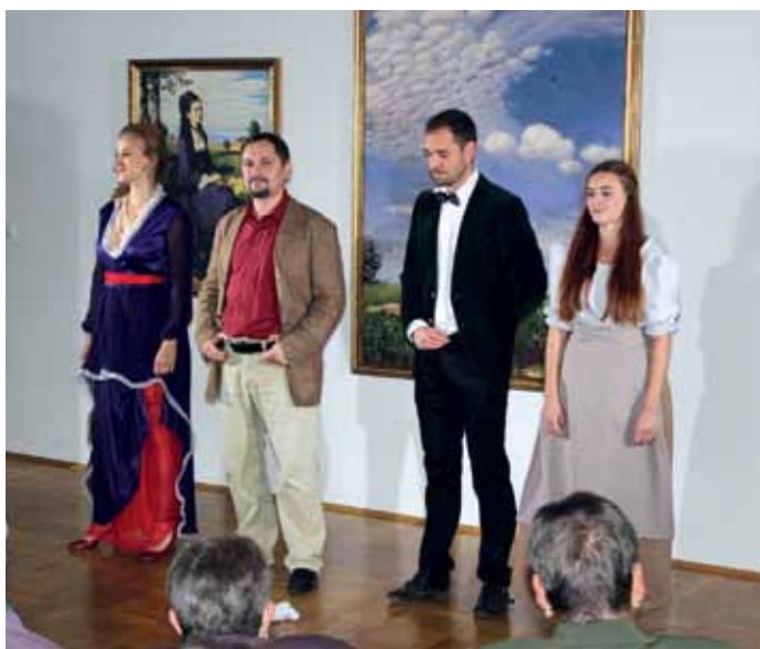
Záverečná pieseň „Z hury od Braniska“

Správne odpovede posielajte v tvare A alebo B medzera meno, priezvisko, adresa na telefónne číslo 0903 529 676. Súťažiť môžete do 29. 12. 2016. Výherca si bude môcť prevziať výhru 30.12. 2016.