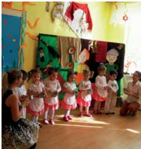
Karneval (vľavo) a vystúpenie pri príležitosti mesiaca úcty k starším (vpravo)