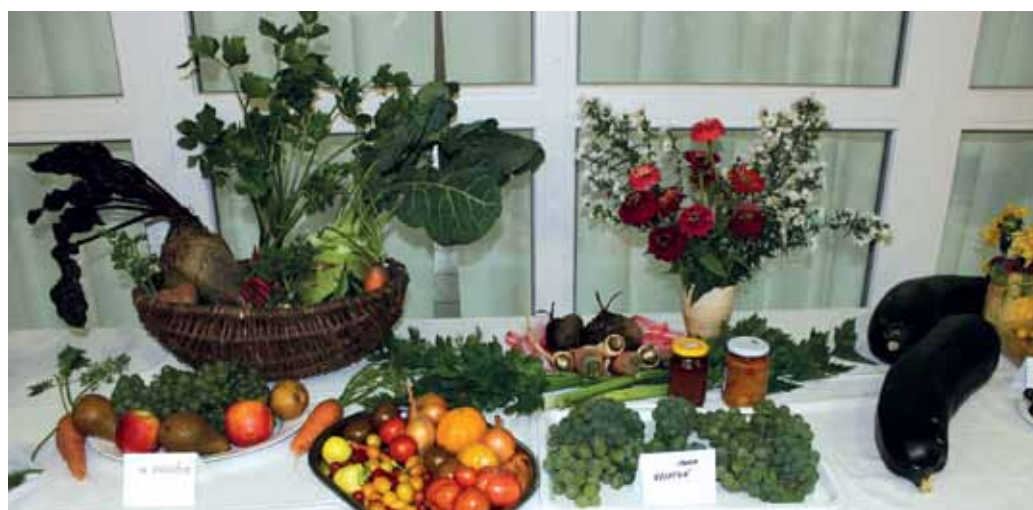
Plody zeme