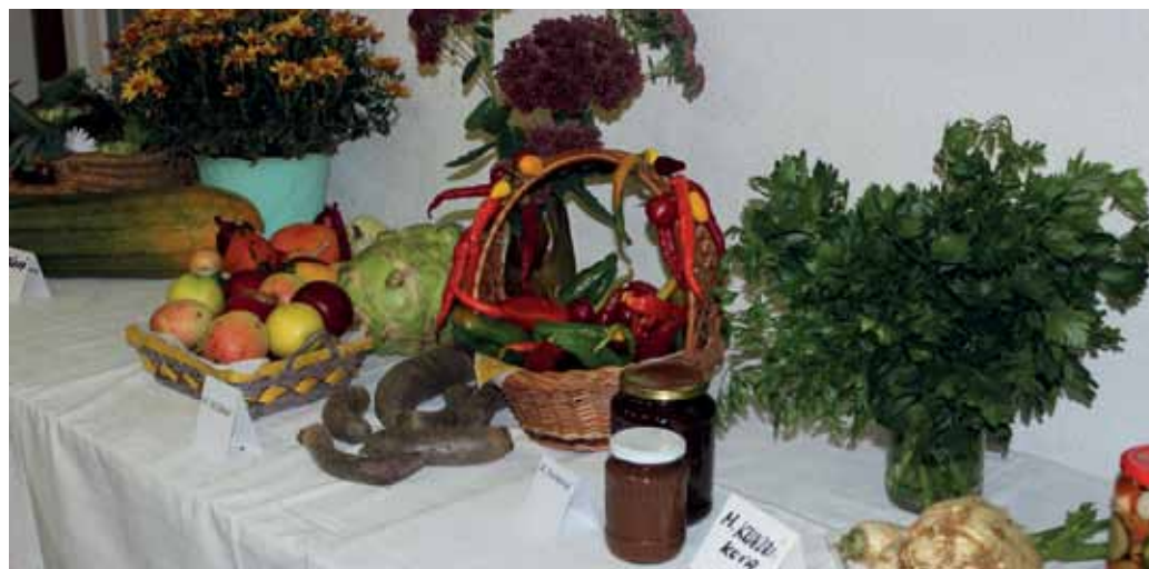
Plody zeme