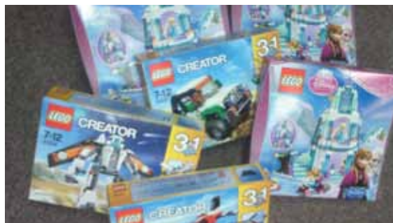
ceny pre víhercov Tajničky a hádanky Pospájaj čísla