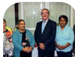
Mesiac úcty k starším » strana 3