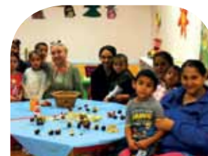
Knižnica » strana 6