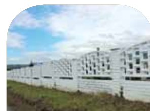
Projekty v obci » strana 2

Pokojom naplnené, láskou obdarené, úsmevom prehriate, šťastím voňavé a Božou milosťou požehnané Vianočné sviatky a Šťastný Nový rok 2017 vám želá starosta obce