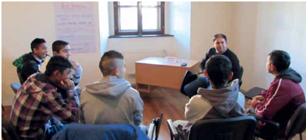
Živá kniha a čitateľa