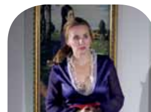
Dáma vo fialovom » strana 5