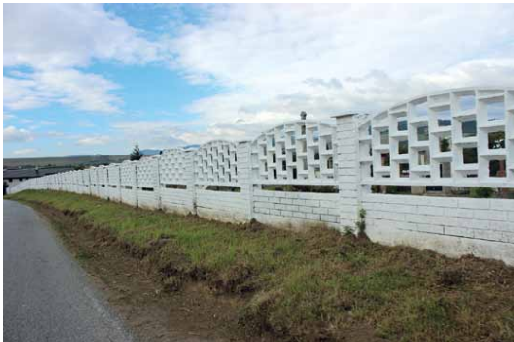
Novonatreté oplotenie