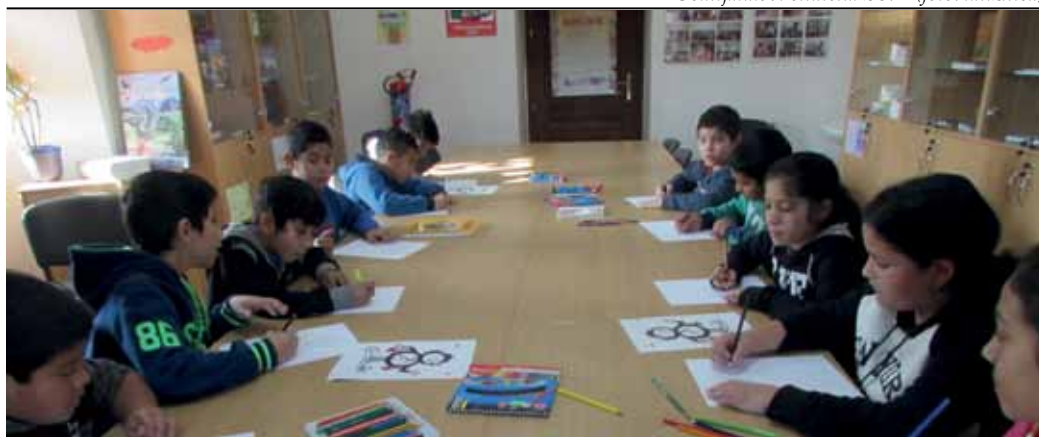
Žiaci 4.A triedy maľujú Osmijanka