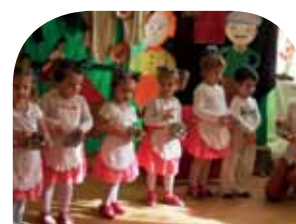
Akcie Materskej školy » strana 7