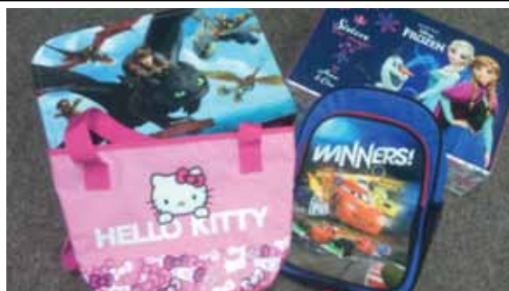
ceny pre víhercov hádanky Bludisko