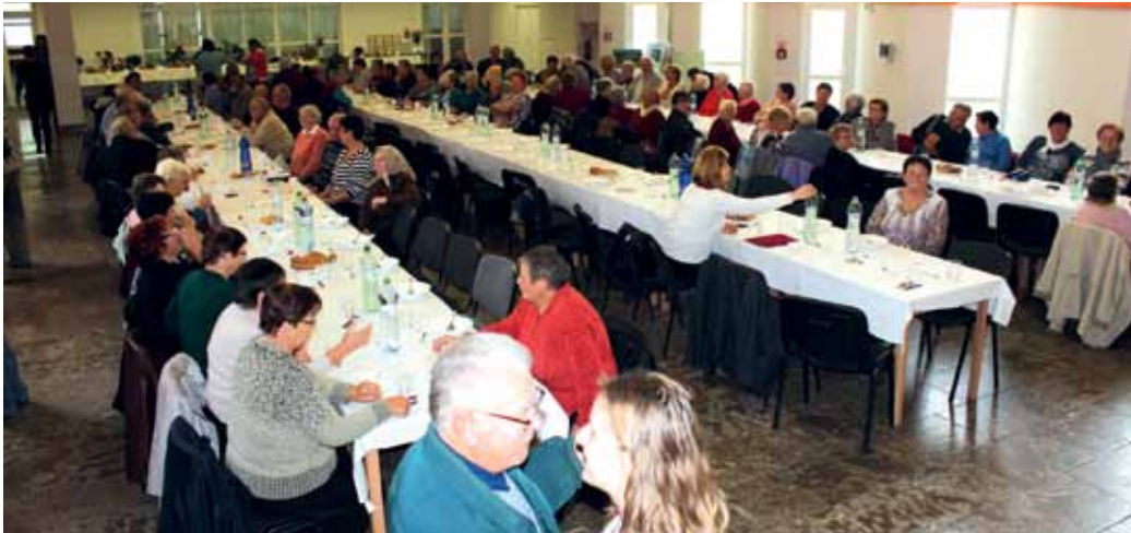
Prítomní hostia