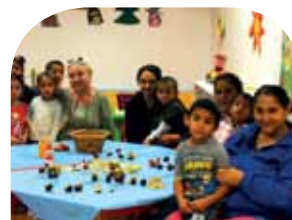
Knižnica » strana 6