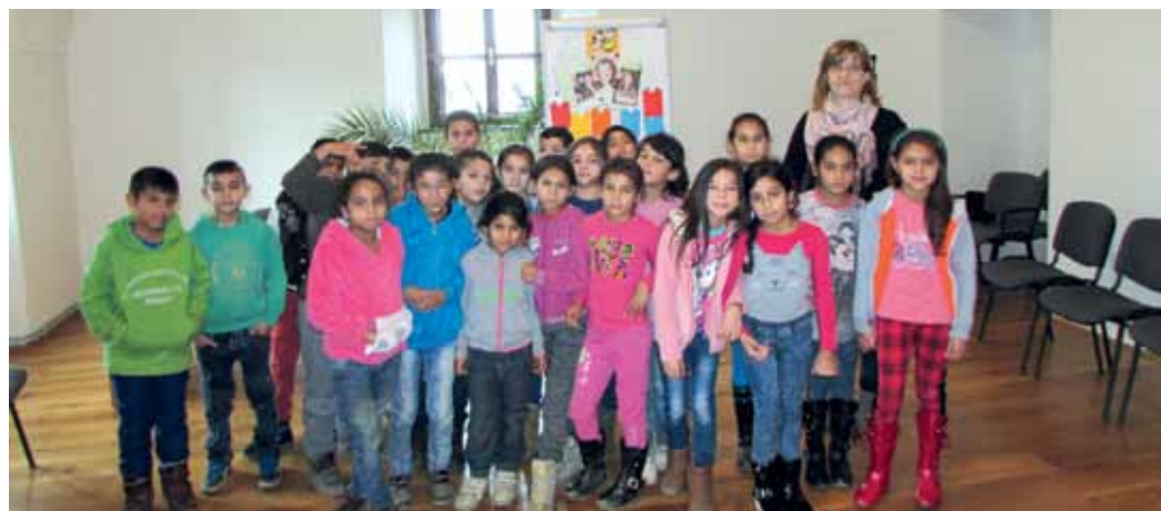
Osmijankovi čitatelia z 3.A