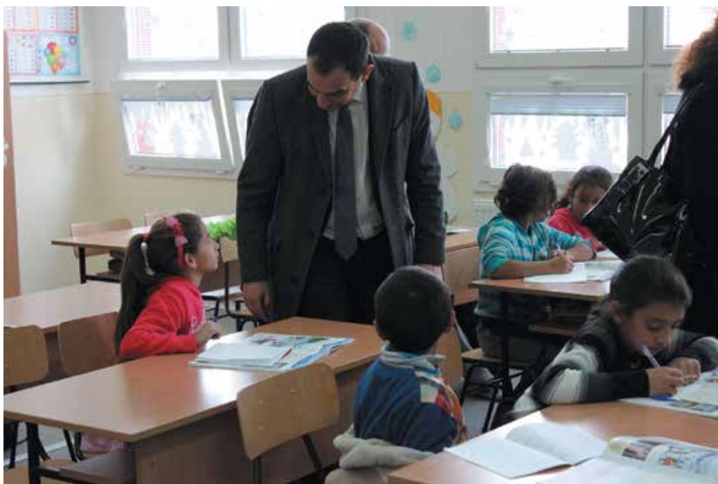
Splnomocnenec vlády počas rozhovoru so žiakmi