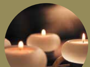
Advent » strana 8-10