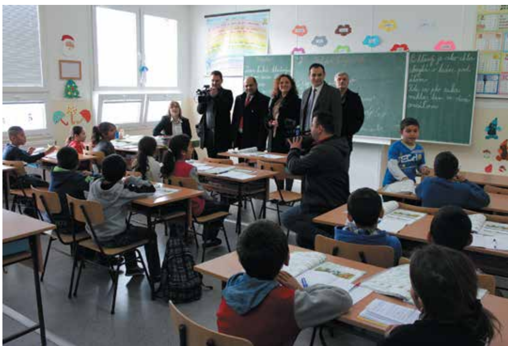
Deti recitujú básničku