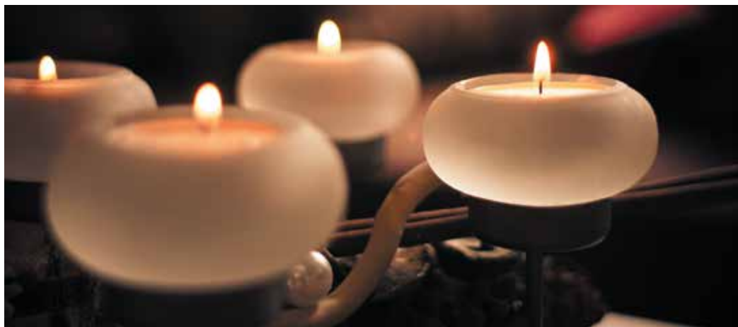
ilustračné foto