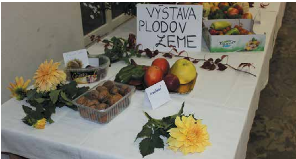
Výstava plodov zeme