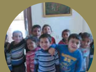
Deti z MŠ v maľarni » strana 7