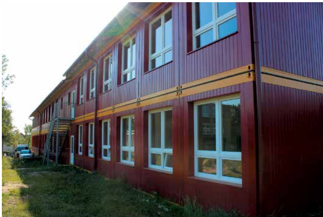
Budova modulovej školy