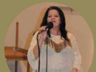
Mesiac úcty k starším » strana 4-5