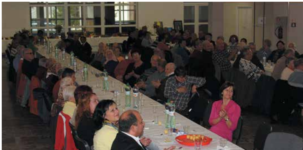
Pozvaní hostia