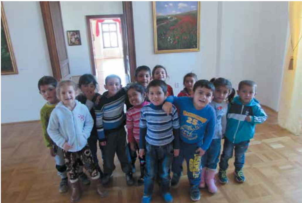
Deti v maľarni