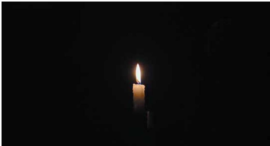
ilustračné foto

K druhému sviatku - Pamiatke všetkých zosnulých - treba povedať, že podľa učenia Cirkvi rozlišujeme tri stavy, kam sa môže človek dostať po skončení pozemskej púte. Nebo, peklo a očistec. Očistec je stav, ktorý nie je trvalý, ale je prechodným stavom a z neho sa človek dostáva do neba. Práve za tých, ktorí ešte nedosiahli nebeský stav, sa modlí celá Cirkev na druhý sviatok - v deň Pamiatky zosnulých. Aby práve modlitbou, a nielen súkromnou, ale aj spoločnou vyprosila dosiahnutie trvalého nebeského stavu. Je zaujímavé pozrieť sa práve v tento deň na naše cintoríny. Ako dokážeme vyzdobiť hroby, pomníky svojich blízkych. Na jednej strane zápa-