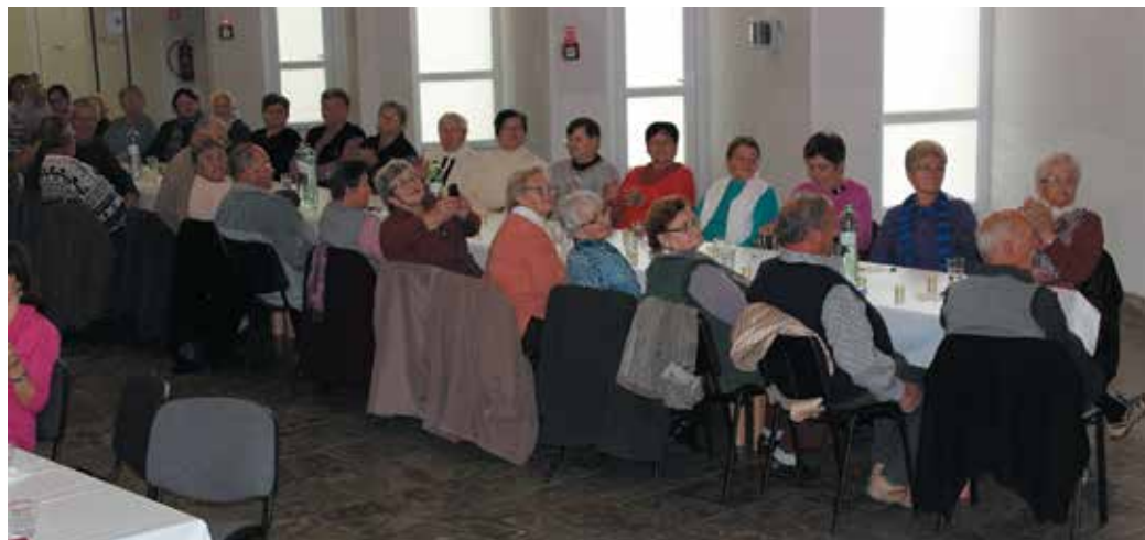
Pozvaní hostia

V živote človeka sú chvíle, keď začne uvažovať o svojom živote a hodnotiť svoju životnú cestu. Na tvári sa strieda úsmev so slzami. Veď boli radosti a boli aj smútky. Pri príležitosti Mesiaca úcty k starším pozval starosta obce občanov na spoločné posedenie.