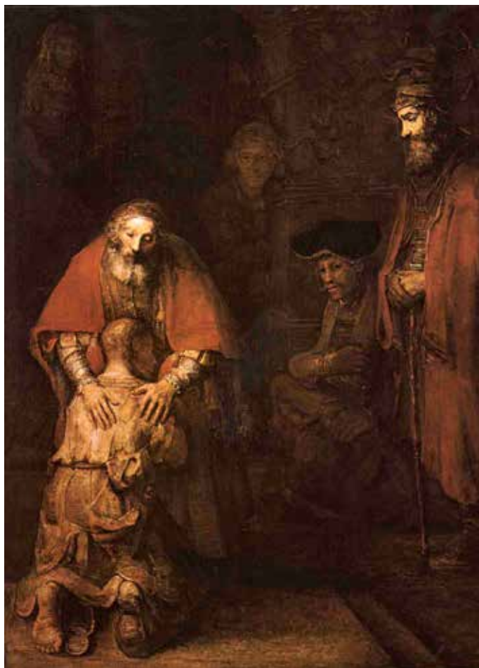
Božie milosrdenstvo je znázornené aj obrazom, ktorý namaloval Harmenszoon Rembrandt van Rijn. (1606-1669) Nachádza sa v Ermitáži v Petrohrade. (2,8?m x 1,8?m)

vnútorných očí. Otcov dotyk je večným žehnaním, synove spochínutie na otcovej hrudi pokojom - okamih prijatia a odpustenia je bez konca, trvá naveky. Takmer slepý otec vidí ďaleko a široko. Jeho zrak chápe stratených mužov a ženy. Je to zrak, ktorý pozná a súcitiť s tými, ktorí trpia tým, že se rozhodli odísť z domova, s tými, ktorí vyplakali more slz, keď sa dostali do osídel hnevu, závidi, zúfalstva. Srdce otca horí nekonečnou túžbou priviesť deti domov. Akoby som si prial svoje deti varovať pred nebezpečenstvami, presvedčiť ich, že doma nájdu to, čo hľadajú inde! Ale jeho láska je príliš