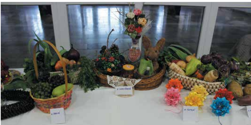
Ručné vyrábané ozdoby a dopestované ovocie a zelenina