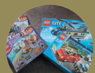
Vianočná súťaž o ceny » strana 11