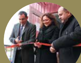
Otvorenie modulovej školy » strana 2-3