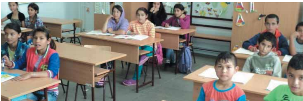
Deti v novej kontajnerovej škole - chýbajú im hojdačky a kolotoč