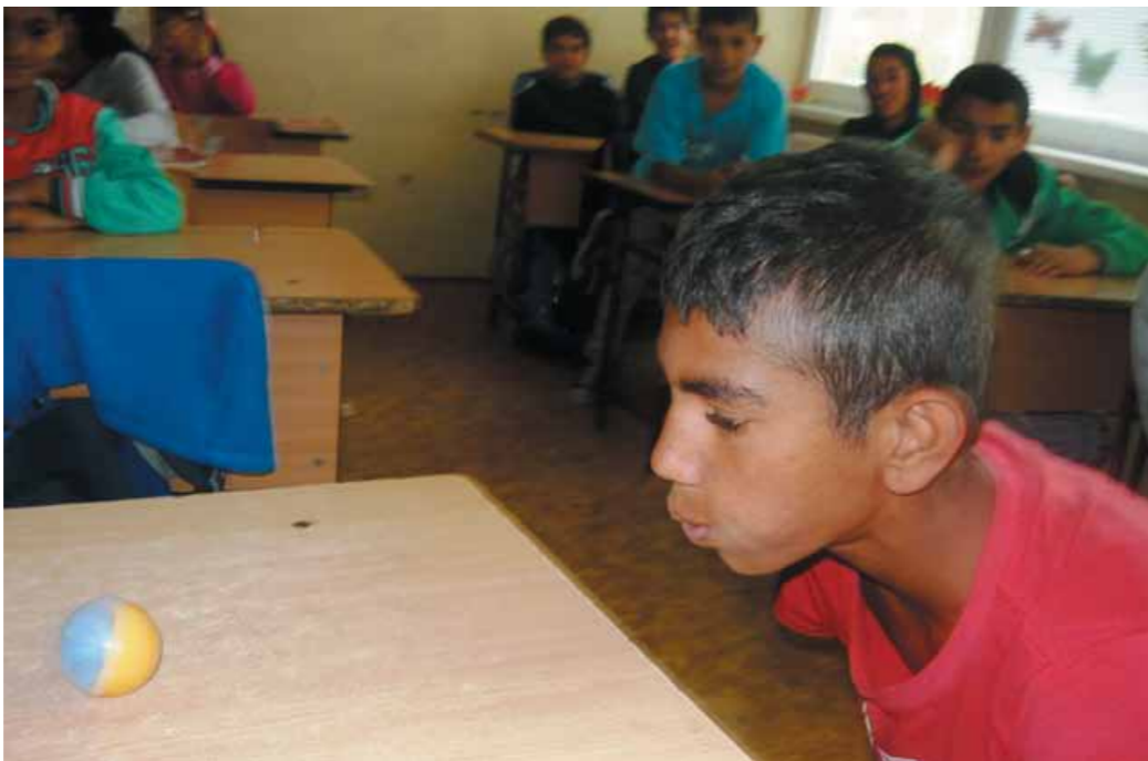
Test fúkania s guľičkou