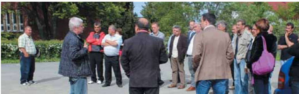
Návšteva splnomocnenca vlády