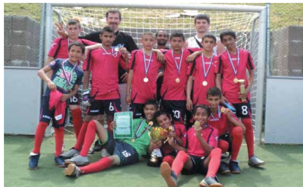
Žiaci ZŠ Jarovnice