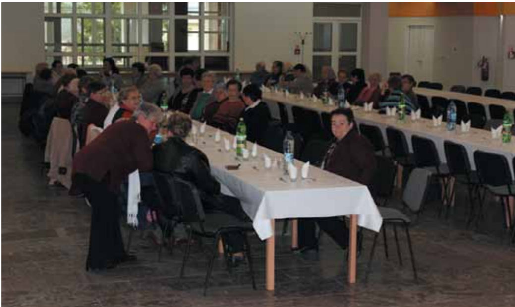
Deň matiek