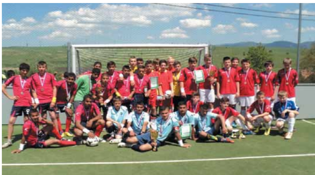
Žiaci ZŠ Jarovnice