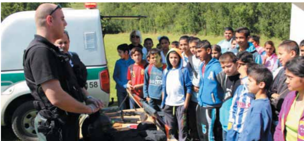
Kynologická ukážka policajného zboru SR