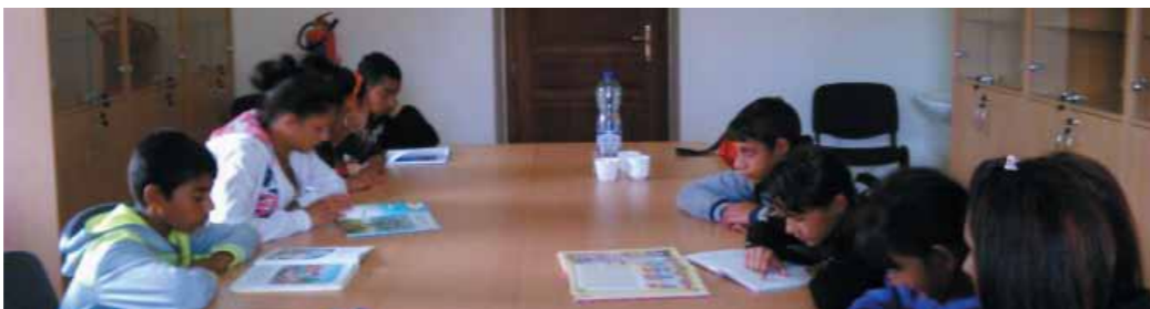
Skupinové čítanie v priestoroch obecnej knižnice v Jarovniciach