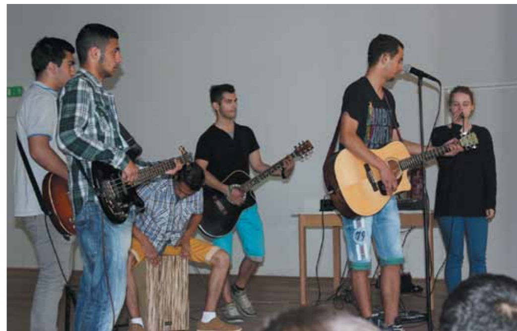
Vystúpenie hudobnej skupiny GPS