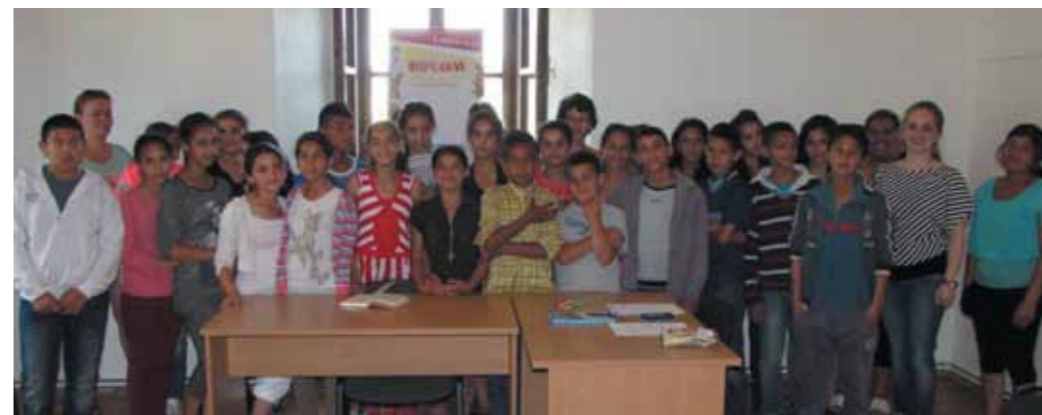
Deti v obcej knižnici v Jarovniciach