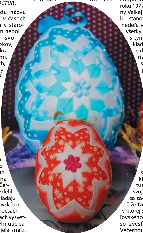
Patchworkové vajičko

a preto sa židovská a kresťanská Veľká noc kryje aj časovo. Nie však úplne, v prvokresťanských spoločenstvách existovali nezhody o dátume slávenia. Niektoré prvokresťanské spoločenstvá tento sviatok slávil spolu so Židmi 14. deň mesiaca nisan, iné na prvú nedeľu po 14. nisan. Zo spisov cirkevného otca sv. Ambróza sa dozvedáme, že Cirkev sa na tom nedokázala dohodnúť. Spor sa snažil riešiť už v polovici 2. storočia pápež Anicent a neskôr pápež Viktor II., ale ukončil ho až prvý Nicejský snem v roku 325, ktorý nariadil, že Veľká noc sa má sláviť v nedeľu po prvom jarnom splne mesiaca, čo môže pripadnúť na jednu z nedeľ od 22.