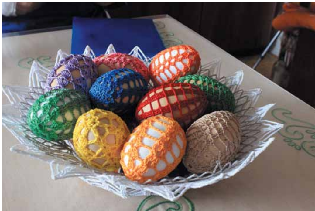
Háčkované vajička

zdobí pani Marciňaková vajička a svoju nádhernú prácu nám rada predviedla a ukázala. Výsledok vidíte na fotografii pod článokm. (spracovala M. V.)