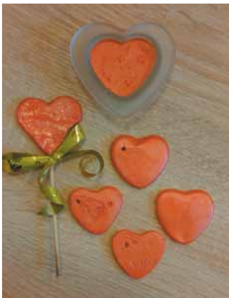
Deti s hotovými výrobkami